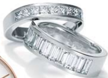
alianzas de oro blanco y diamantes c.p.v.