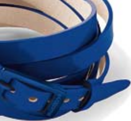
Swatch pulsera 20€