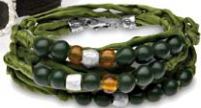
pulseras de La Bruixeta, seda, plata y piedras semipreciosas, en colores variados, desde 44€. Plata de Palo. Pulsera de seda verde, 94€.