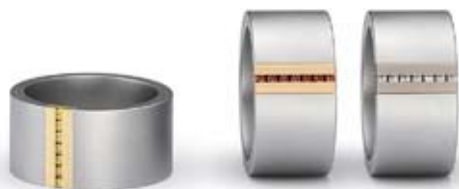
Anillo Steelline. oro, acero y diamantes desde 600€

Si eres de los que se está preguntando: ¿qué le podría regalar? Esta guía te ayudará. Y si lo que te apetece es darte un capricho, ahí va nuestra selección.