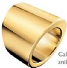
Calvin Klein anillo 70€