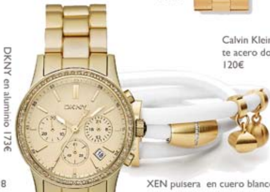
DKNY en aluminio 173€