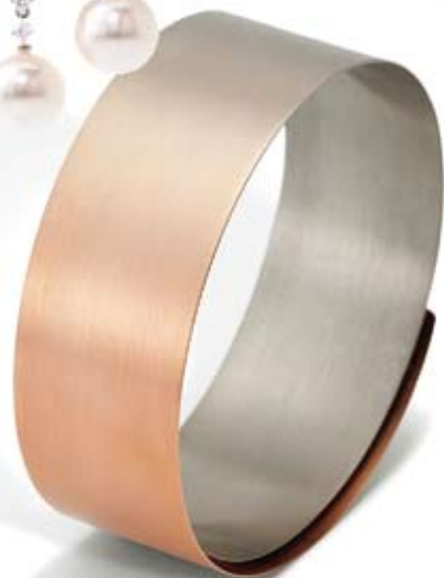
brazalete Aura desde 3375€