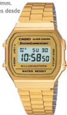
CASIO. La resurrección de un mito. 46€