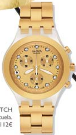
SWATCH Creando escuela. 112€