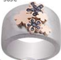
anillo trébol de la suerte 565€