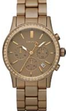
reloj DKNY 198€