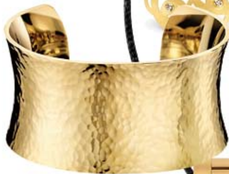
CALVIN KLEIN. Brazaletes 140€