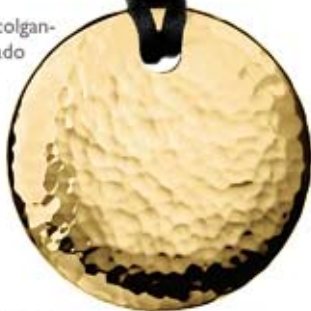
Calvin Klein colgan- te acero dorado 120€