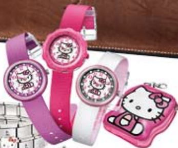
Reloj Flik Flak 49€