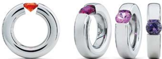
® Niessing De acero inoxidable. Diseño premiado Piedra preciosa de color sintético con talla brillante. 245€