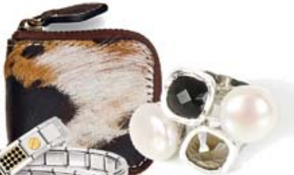
anillos La Bruixeta 169€