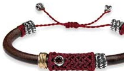
pulsera Plata de Palo 146 €