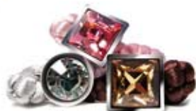
anillo Trenzza 21 €