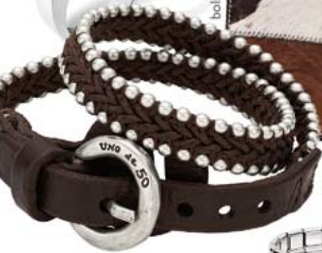
Pulsera Uno de 50 69€