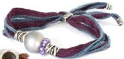
los pañuelos de Plata de Palo. 125€

¿Qué exótico debió resultar para los europeos el tacto de la seda!