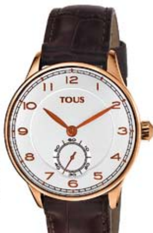
reloj Tous. 235€