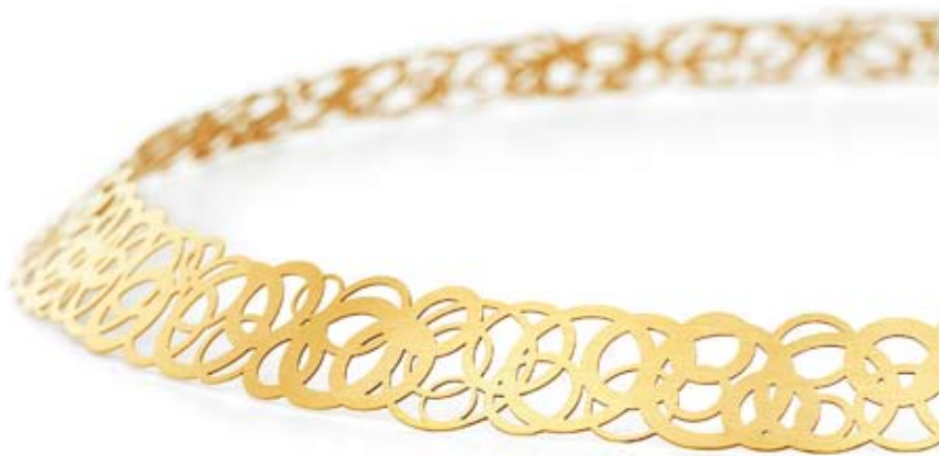
Filigrana de delicados círculos ornamentales, hecha de oro amarillo, gris o rojo.