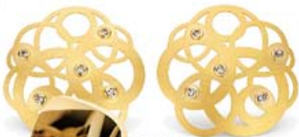
NIESSING. Pendientes oro amarillo 750mm. con brillantes desde 2580€