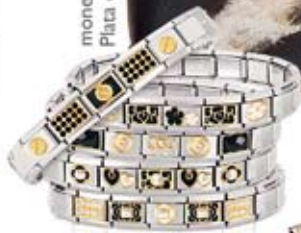
pulsera Nomination acero con oro