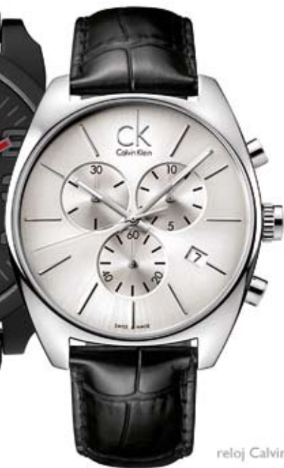
reloj Calvin Klein