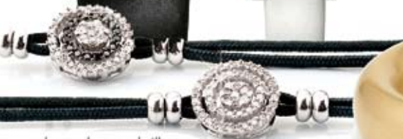
pulseras de oro y brillantes desde 1210€