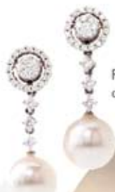
Pendientes de oro y brillantes, con perla cultivada