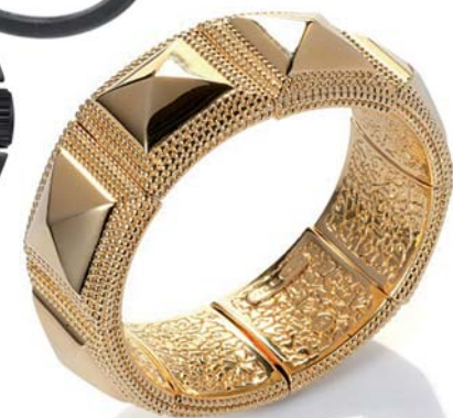
20. Brazalette Viceroy vuelve el dorado, 115€