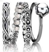
16. Pandora presenta nuevas ideas: anillos combinables, charms con piedras, a partir de 39€