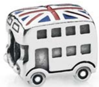
Pandora desde 19 €